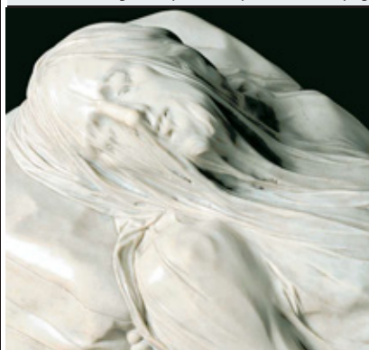
Il "Cristo Velato" nella Cappella Sansevero

La casa editrice bolognese Scripta Maneant pubblica un libro di pregio sulla Cappella Sansevero