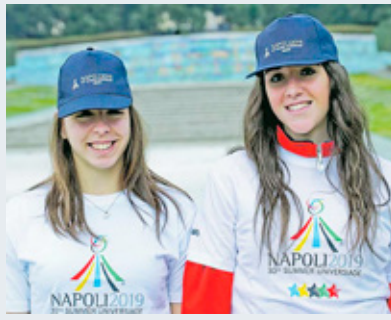
ANTONIO DI COSTANZO, pagina II

L'ex campione di pugilato Patrizio Oliva, testimonial dell'evento sportivo, lancia un appello alla partecipazione. Rimborso giornaliero di 25 euro e trasporti gratis