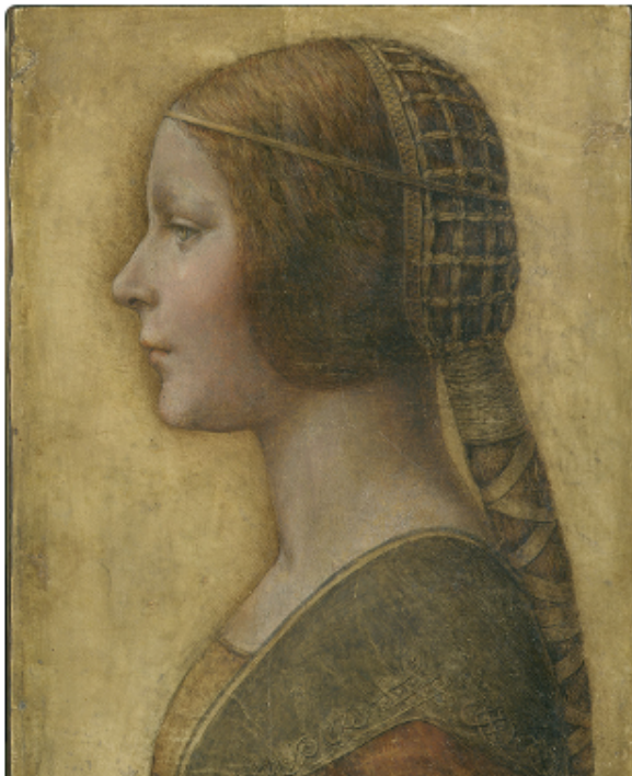
"La bella principessa" di Leonardo da Vinci